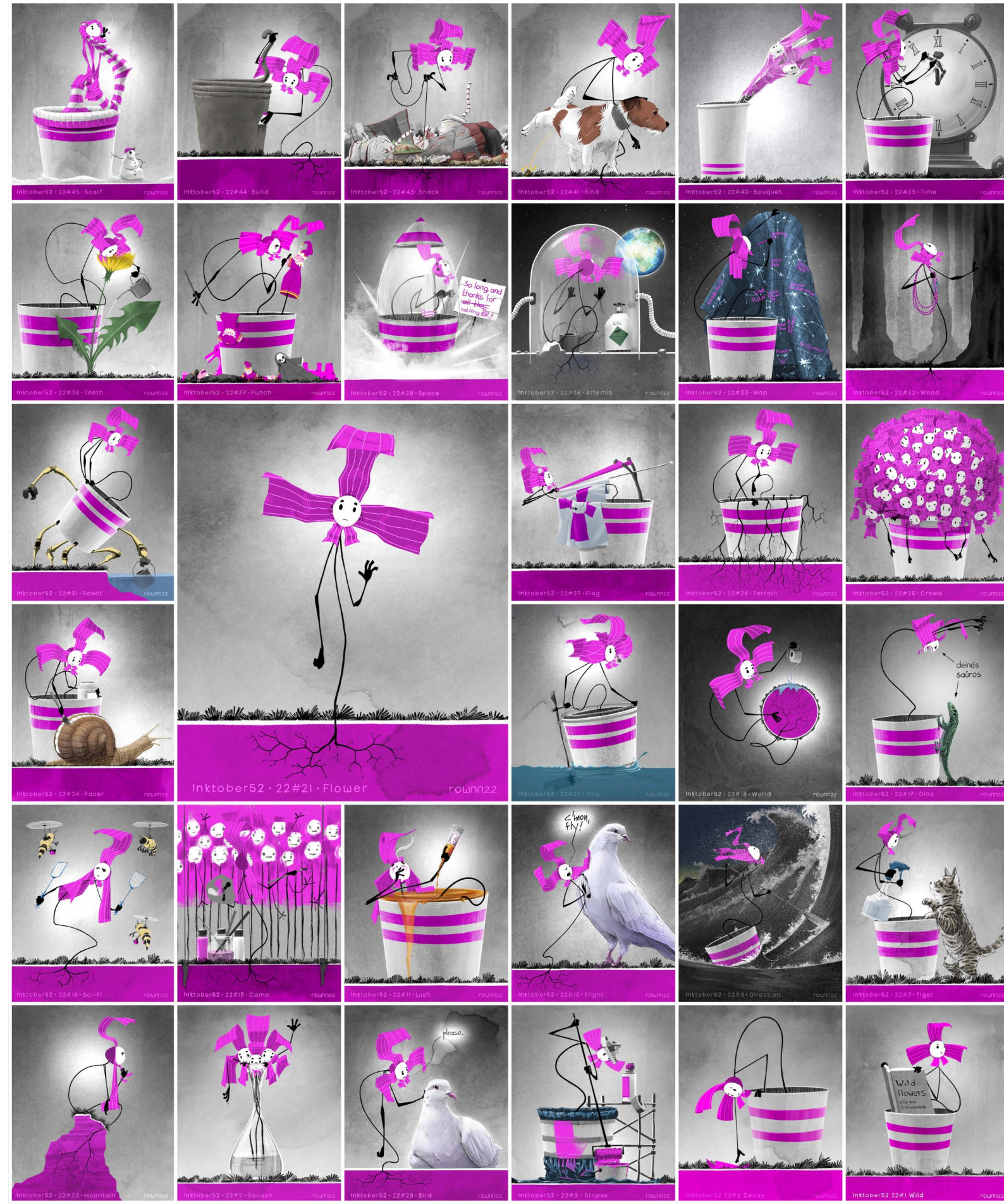
Illustration | 2022 | persönliche Arbeiten